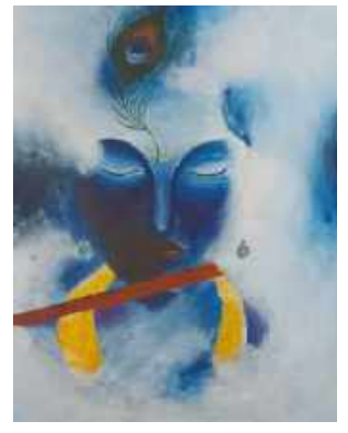
Prisha Goswami 11-A