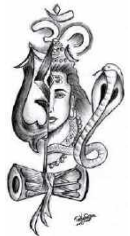
Tikendra parekh 10-C