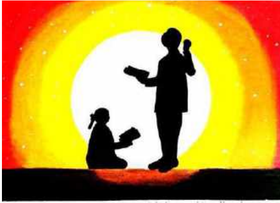
Shrungi Mahida 10-D