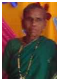
Sr. Dipika's Mother