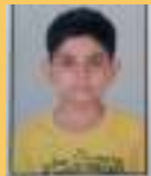
Modi Tirth 9 - D

Christmas is a festival that embellishes us with countless joy and happiness! This beautiful and beloved festival of Christmas is welcomed every year, on 25th December. It marks the birthday of Lord Jesus Christ, the founder of Christianity. Christmas signifies love, kindness, selflessness and happiness. Christmas is celebrated enthusiastically all over the world by decorating our houses, giving gifts to one another, singing Christmas carols and praying to the almighty for the betterment of humanity. Christmas is always incomplete without our dear Santa Claus! Santa Claus, also known as Father Christmas is always awaited by children as children believe that Santa gives gifts to them on Christmas Eve.